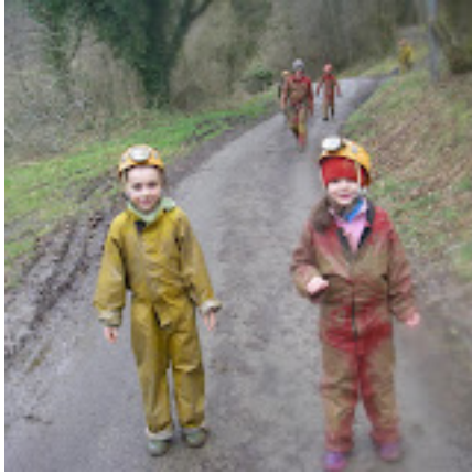
ESCB : Grotte de Capbis