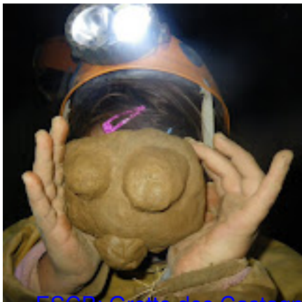
ESCB. Grotte des Castagnets - 18 Octobre 2009